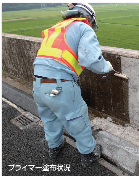
プライマー塗布状況